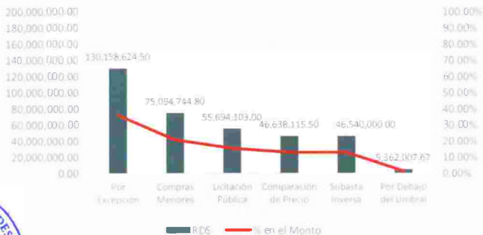
Procesos cargados en el portal de Compras por Modalidad Trimestre Julio-Sept., Año 2023