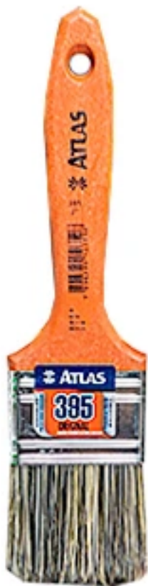
14) Brocha para pintar 2"