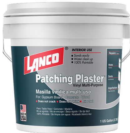
5) Masilla para madera