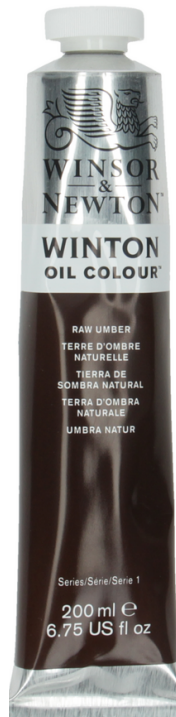
8) Oleo #3 Marron, Caoba