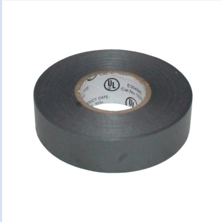
TAPE ELECTRICO MÁSTER 0.13X25 METROS N1925G