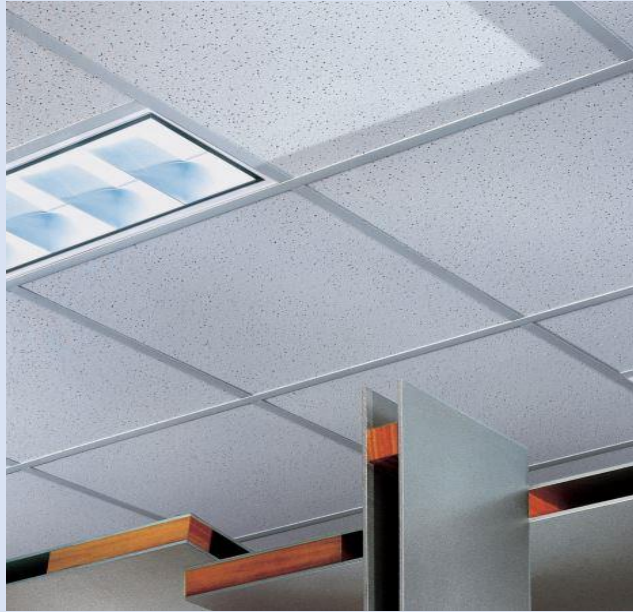
METRO DE PLAFON COMERCIAL 2X4