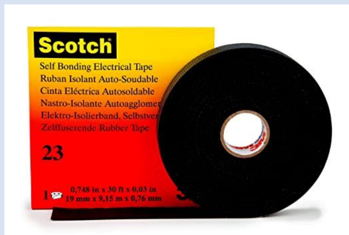
TAPE DE GOMA SUPER 23+ 3M SCOTCH