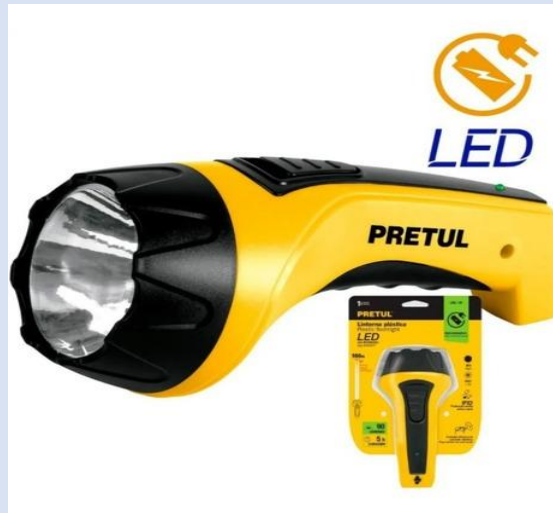
LINTERNA LED PRETUL /TRUPER