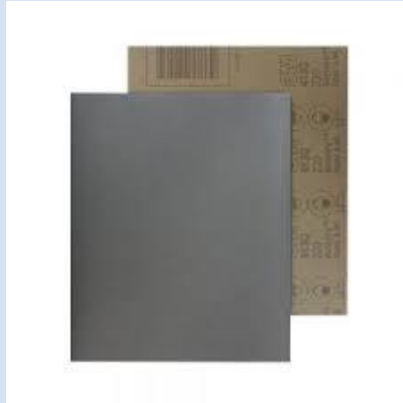
LIJA DE AGUA # 100