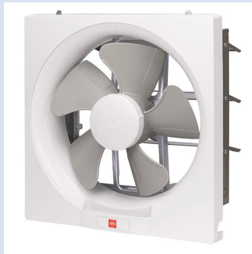
EXTRACTOR DE AIRE KDK 30AUHT PARED 670CFM