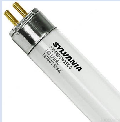
TUBO FLOURESCENTE FP54 SYLVANIA