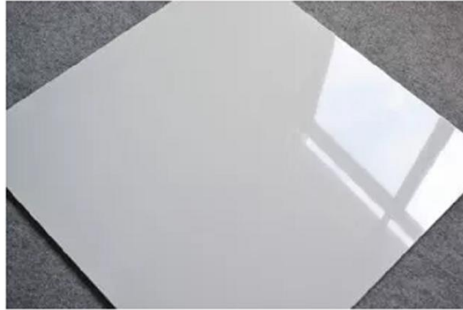
PORCALANATO 60X60 SUPER WHITE

Aplicaciones y usos: Amarre de estribos, cabillas y encofrados, usos industriales y artesanales, Cercas para animales, caballeriza, fabricación de gaviones.