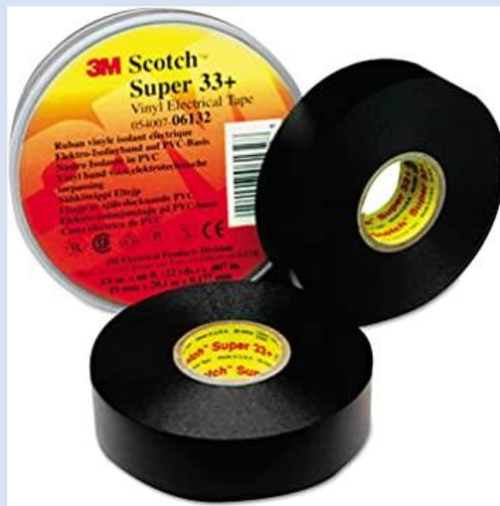
TAPE VINIL SUPER 33+ 3M SCOTCH