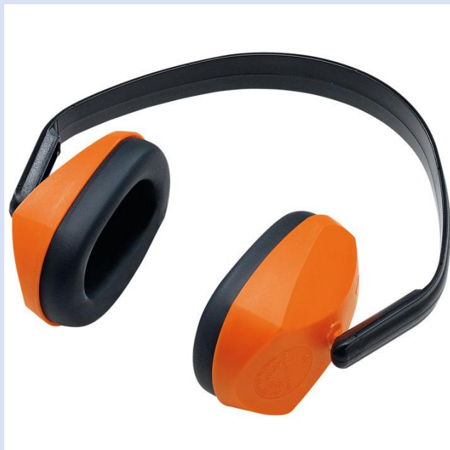
PROTECTOR DE OIDOS