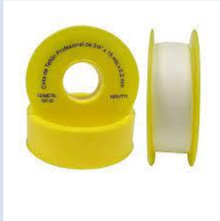
TEFLON AMARILLO 3/4X15M