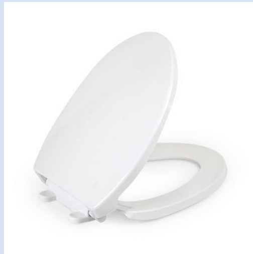
ASIENTO PARA INODORO ELONGADO BLANCO MARCA ELITE