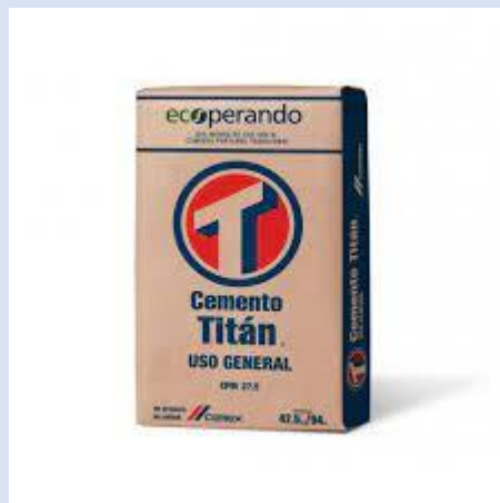
CEMENTO GRIS 42.5 KG TITAN