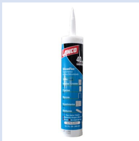
SILICON TRANSPARENTE Y BLANCO LANCO