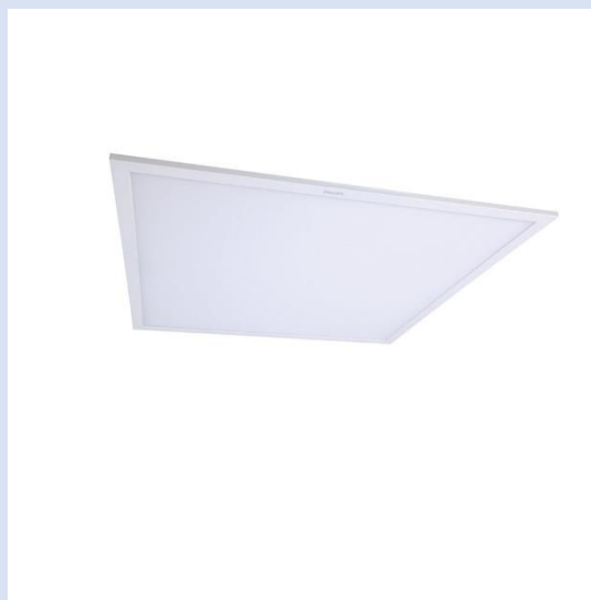
LUMINARIA LED P/PLAFON 2X2