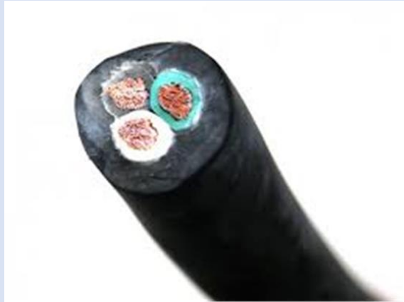
ALAMBRE DE GOMA 12/3 KV-R 2.5MMX3