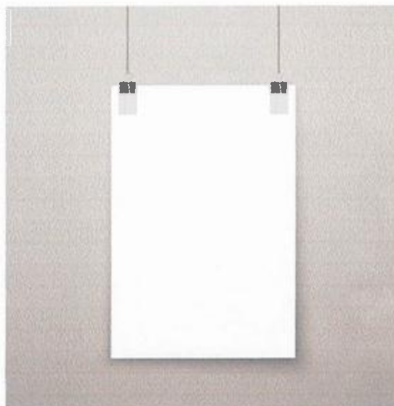
Imagen solo como referencia