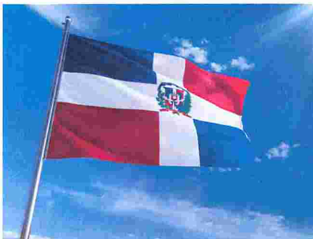
Imagen solo como referencia