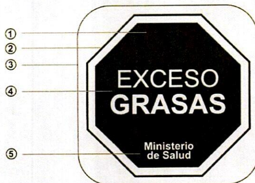
Figura 2. Elementos del descriptor: (1) Base octogonal que contiene el mensaje; (2) Margen blanco con borde negro; (3) Margen blanco con borde negro de recorte sobre fondo; (4) Mensaje principal descriptor; (5) Firma del Ministerio de Salud.

Párrafo VIII: Cuando un producto tenga más de un panel principal de exhibición, el EFAN deberá aplicarse en cada uno de los paneles principales de exhibición siguiendo lo estipulado en los ARTÍCULOS QUINTO, SEXTO y SÉPTIMO .