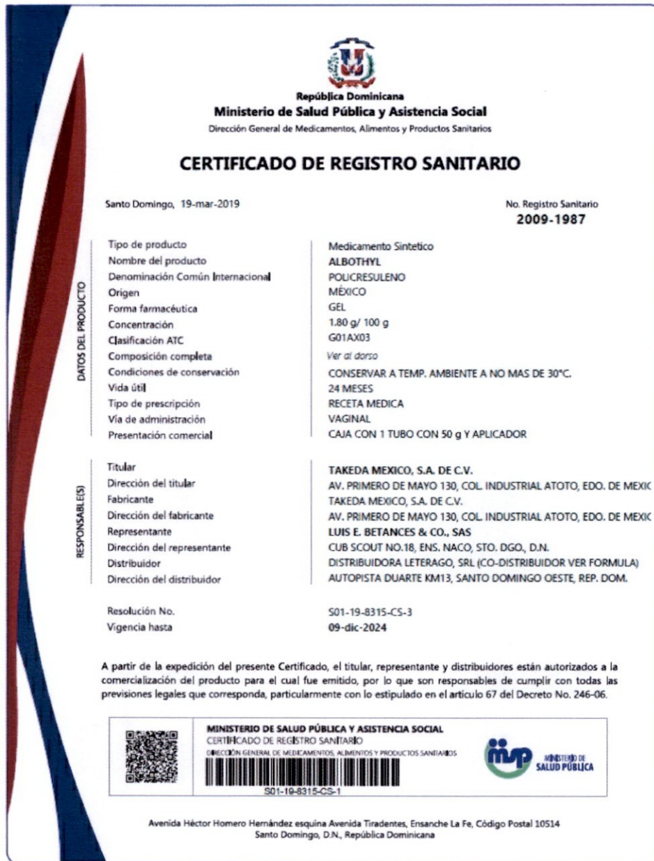
Imagen Certificado de Registro Sanitario